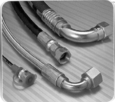
Tubos de baja y alta presión.